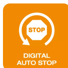
Digitális automatikus leállítás

Automatikusleállítás-funkció, amely az előre beállított nyomásérték elérésekor kapcsol be